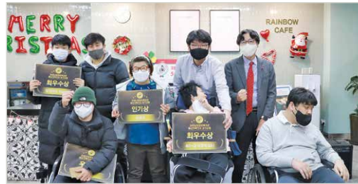
장기자랑 콘테스트 시상식