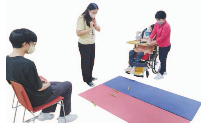
한가위 맞이 '전통놀이-옷대결'