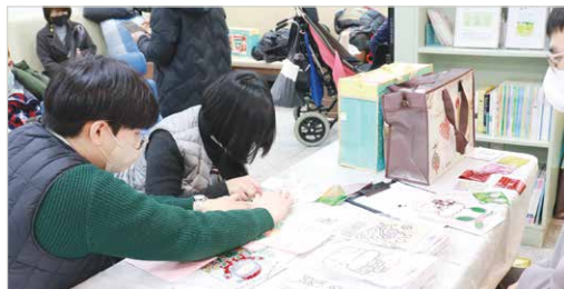
크리스마스 카드 만들기