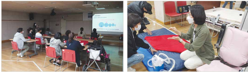
돌봄제공자를 위한 보조기기 활용교육

서울시서남보조기기센터에서는 안전한 이동을 위한 보조기기 활용 교육을 실시하였습니다. 교육은 장애인 가족 및 활동지원사 20명을 대상으로 10월 11일(화), 10월 13일(목) 중 택일 오후 2시부터 약 2시간 동안 진행하였으며, 이동식전동리프트·허리안기벨트 소개와 사용방법 안내, 그 외 돌봄관련 보조기기 전시 및 공적급여 정보를 제공하였습니다. 추가로 실습을 통해 교육 참여자가 직접 기기를 조작하고 사용법을 익히는 시간도 가져보았습니다. 이번 교육을 통해 이송용 보조기기에 대한 이해가 높아지고 교육 참여자가 이전보다 편안한 돌봄이 가능해지기를 기대합니다.