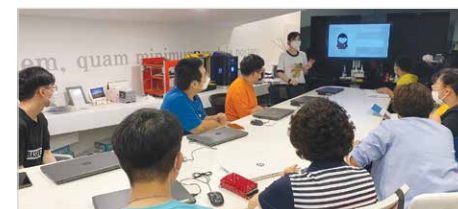
3D프린터 직업훈련 체험

세부내용 8월 1일(월)~8월 12일(금) 총 2주간 여름방학기간을 맞아 특수학교 및 특수학급에 재학중인 뇌성마비 청소년 8명을 대상으로 진로·직업교육을 실시하여 자기탐색, 직업교육, 진로체험활동을 실시하였습니다. 학교에서 쉽게 접할 수 없었던 진로체험활동을 경험함으로써 개인의 적성과 흥미를 탐색하고 진로를 계획함에 따라 고등학교 졸업 이후 미래 계획을 수립하고 준비하여 성인기를 안정적으로 맞이하고 적응할 수 있는 기회가 될 수 있도록 지원하였습니다. 진로체험활동으로는 4차산업 직종 중 3D프린터, 코딩, 스마트팜을 견학하였으며, 이 외에도 바리스타, 제빵, 보호작업장 견학을 실시하고 지역사회 내 강서구 진로직업체험센터 연계하여 모스아트 등을 경험하였습니다. 여름방학을 맞아 나에 대해 탐색해보고 직업을 경험해보고 체험해보므로써 적성과 진로에 대해 진지하게 고민해볼 수 있었던 시간이었습니다.