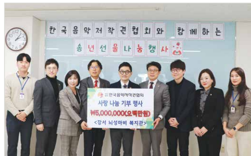
한국음악저작권협회 기부금 전달