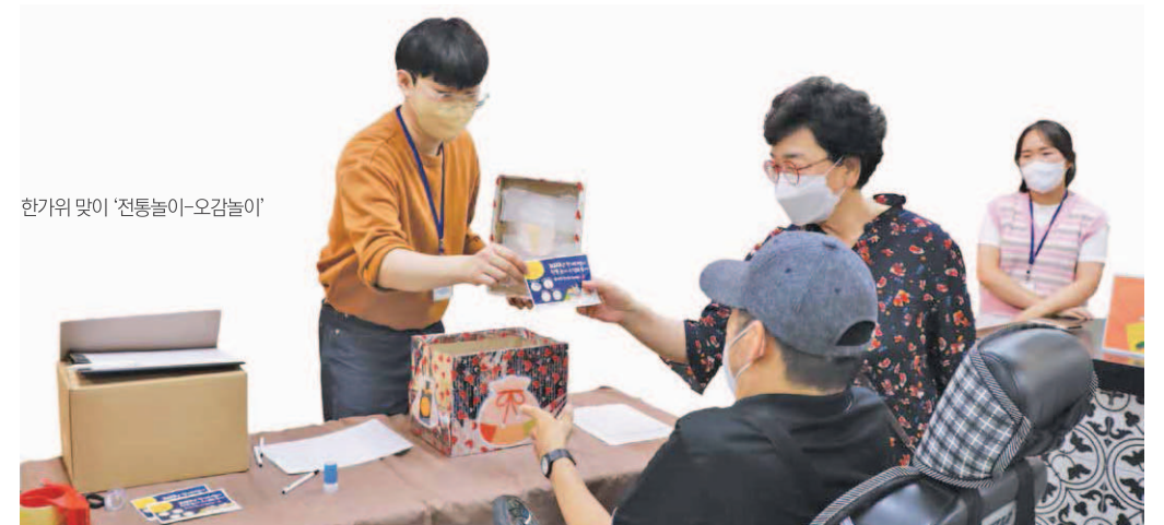
한가위 맞이 '전통놀이-오감놀이'

9월 7일(수)~9월 8일(목), 우리나라 최대 명절인 추석을 맞이하여 성인뇌성마비장애인인과 가족 약 165명이 함께한 '풍성한 한가위행사'를 열었습니다. 먼저, 보이는 라디오 '가족 한마당'으로 유튜브를 통해 사전에 신청한 사연과 신청곡을 소개하며 시청자들과 실시간으로 소통하였습니다. 두 번째는 한가위 맞이 '전통놀이 스탬프 투어'로 오감놀이, 공주머니 던지기, 천 제기 튕기기, 옷대결 등 다양한 전통문화체험에 참여하며, 우리의 소중한 문화를 이해하고 경험할 수 있는 시간을 가졌습니다. 마지막으로 한가위 질주 '닌텐도 마리오카트'를 통해 아동부터 성인까지 즐길 수 있는 닌텐도게임으로 소정의 선물까지 나눠주는 이벤트도 진행하였습니다.