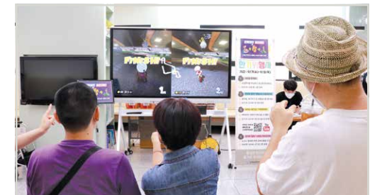
한가위 질주 '닌텐도 마리오카트'