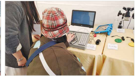
한손자용 키보드 체험