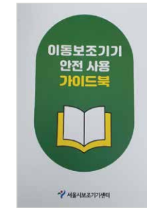
이동보조기기 안전사용 가이드북