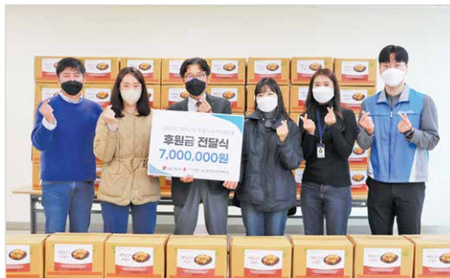
LG이노텍 후원금 전달식 후 김정김치 나눔

세부내용 7월~12월 하반기 동안 LG이노텍, 한국음악저작권협회, 국민은행 방화동 지점, 한국주택금융공사, 강서희망나눔복지재단 등에서 복지관에 후원금 및 후원물품을 전달해주셨습니다.