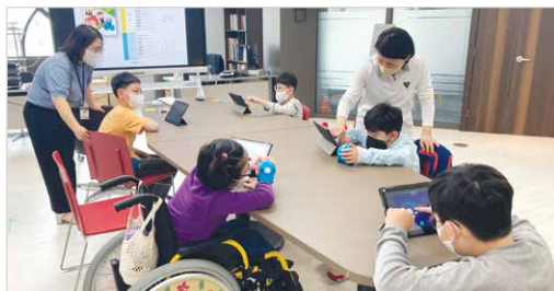
로봇코딩교실(코딩으로 로봇 움직이기)

세부내용 가족지원팀은 상·하반기 총 8주간 토요일프로그램을 진행하였습니다. 토요일프로그램은 주중 복지관 이용이 어려운 뇌성마비장애아동 및 청소년을 대상으로 다양한 분야의 특별활동을 진행함으로써 뇌성마비장애아동 및 청소년의 창의력 증진 및 여가생활의 기회를 지원하였습니다. 상반기에는 로봇코딩 교실을 운영하여 코딩을 이용한 이어달리기, 공 넣기, 술래잡기, 컵 무너뜨리기 등 다양한 활동을 진행하는 시간을 가졌습니다. 하반기에는 창의사고보드게임을 운영하여 또래와의 보드게임을 통해 뇌성마비장애아동 및 청소년의 대인관계 능력과 추리력, 사고력, 기억력 증진을 지원할 수 있었습니다.