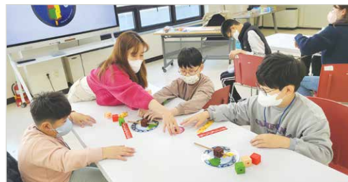
창의사고보드게임(추리력, 기억력 증진활동)