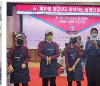
바리스타 대회 시연