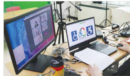
스토리뉴스 자원봉사자 회의 모습

세부내용 복지관의 서비스 및 프로그램 소식들을 유튜브 영상제작을 통해 뇌성마비장애인 및 가족들과 지속적인 유대감 형성과 정보접근성을 보장하였습니다. 제작된 콘텐츠로는 장애인식개선과 장애인계 이슈를 담은 카드뉴스형식의 스토리뉴스(22회), 매월 복지관의 정기적인 소식을 이용자와 함께 전달하는 월간뉴스(9회), 복지관에서 진행하는 프로그램을 인터뷰 형식으로 소개하는 프로그램 리뷰(8회), 복지관에서 크게 진행되는 행사를 담은 홍보영상(2회), 이용자와 직원들이 요청하는 영상을 제작하는 콘텐츠 기획(1회) 총 42회에 해당하는 영상을 제작하였습니다.