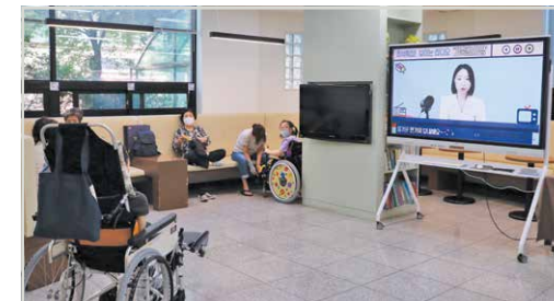
보이는 라디오 '가족 한마당'

9월 7일(수)~9월 8일(목), 우리나라 최대 명절인 추석을 맞이하여 성인뇌성마비장애인인과 가족 약 165명이 함께한 '풍성한 한가위행사'를 열었습니다. 먼저, 보이는 라디오 '가족 한마당'으로 유튜브를 통해 사전에 신청한 사연과 신청곡을 소개하며 시청자들과 실시간으로 소통하였습니다. 두 번째는 한가위 맞이 '전통놀이 스탬프 투어'로 오감놀이, 공주머니 던지기, 천 제기 튕기기, 옷대결 등 다양한 전통문화체험에 참여하며, 우리의 소중한 문화를 이해하고 경험할 수 있는 시간을 가졌습니다. 마지막으로 한가위 질주 '닌텐도 마리오카트'를 통해 아동부터 성인까지 즐길 수 있는 닌텐도게임으로 소정의 선물까지 나눠주는 이벤트도 진행하였습니다.