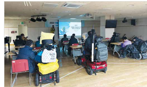
이동보조기기 관리 및 안전교육 진행

서울시서남보조기기센터에서는 서울시 거주 등록 장애인 및 보호자 12명을 대상으로 겨울철 이동보조기기 관리 및 안전 교육을 실시하였습니다. 교육은 12월 15일(목) 오후 2시부터 약 2시간 동안 진행하였고 '겨울철 이동보조기기 유지관리 방법, 주요 고장 증상별 진단 및 수리업체 안내, 전동 이동보조기기 배터리 관리, 법률·안전인식 교육'의 내용으로 구성하였습니다. 교육을 마친 후에는 참여 장애인 및 보호자들에게 이동보조기기 안전사용 가이드북과 겨울철 방한대비용품 넥워머도 배부하였습니다. 이번 교육을 통해 이동보조기기의 안전한 사용이 이루어지길 기대합니다.