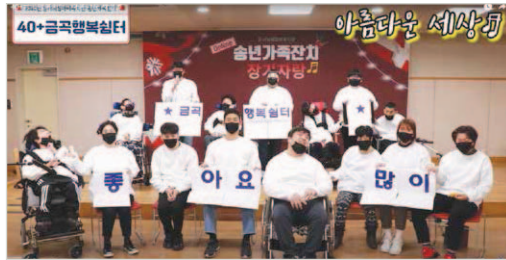
장기자랑 콘테스트 참가자

12/21(수)~12/27(화) 복지관에서는 뇌성마비장애인과 가족 그리고 직원이 한 해를 함께 마무리 할 수 있는 송년 가족잔치를 열었습니다. 이번 행사는 크게 5가지 이벤트로 진행되었습니다. 첫 번째 이벤트는 뇌성마비장애인과 가족들의 재능을 마음껏 뽐내는 온라인 장기자랑 콘테스트가 있었으며, 사전에 영상을 녹화하여 유튜브에 업로드 하는 방식으로 진행되었습니다. 이후 조회수와 좋아요 개수를 통해 시상을 하였으며, 최우수상 2명과 우수상 및 인기상 각 1명씩 선정되어 4명에게 소정의 선물을 드렸습니다. 두 번째 이벤트는 올 한해 복지관의 하이라이트 순간을 담은 사진을 1층 로비에 전시하여 복지관에서 즐겁고 행복했던 순간을 공유하였습니다. 전시기간을 마친 뒤 본인 또는 가족이 찍힌 사진을 원하는 분들께 나눠드렸습니다. 세 번째 이벤트는 관장 인사말, 신입직원 소개, 서비스 및 치료모습 등을 한 해를 돌아보는 영상을 제작하여 유튜브에 업로드 하였습니다. 네 번째 이벤트는 뇌성마비장애가족 총 63명이 참여하여 크리스마스 카드를 만들고 편지를 쓰는 활동을 하였으며, 이벤트에 참여한 가정에게 완구용품이 들어있는 크리스마스 선물꾸러미를 전달하였습니다. 다섯 번째 이벤트는 열린배움터 수강생들이 1년동안 다양한 수업을 통해 만들었던 그림, 시, 천연공예, 향초 등을 전시하였습니다.