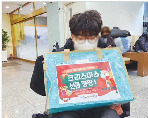
강서희망나눔복지재단 완구제품 나눔