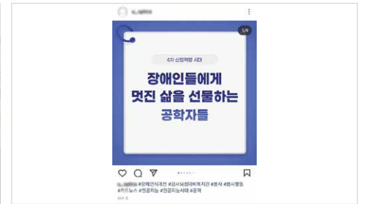
자원봉사자 개인SNS에 게시물 업로드