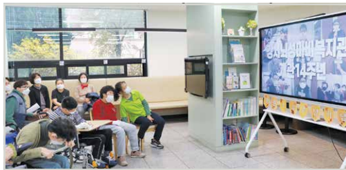
개관 14주년 기념 영상 시청