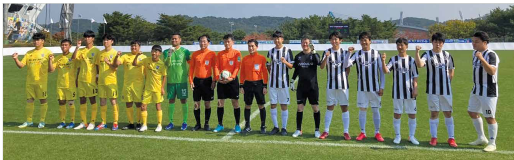
경기 전 단체사진