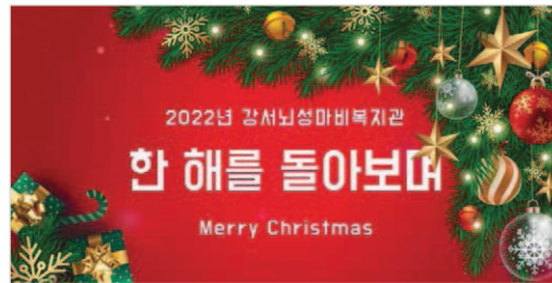
한 해를 돌아보며 영상