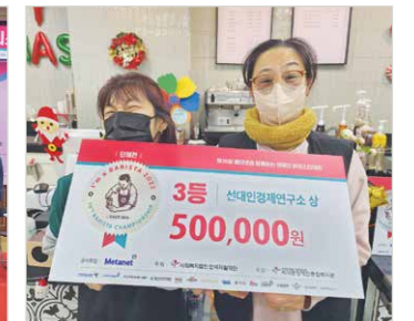
단체전 3위 입상