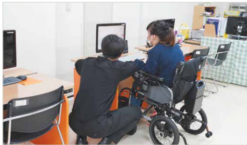
3D프린터 프로그램 교육

서울시서남보조기기센터에서는 3D프린터에 관심이 있는 뇌성마비장애인 3명을 대상으로 활용 교육을 실시하였습니다. 8월 23일(화)부터 11월 1일(화)까지 매주 1회 2시간씩 총 10회 진행하였고 교육 참여자가 3차원 설계·슬라이싱 프로그램 및 3D프린터 활용 방법 등의 사용법을 숙지할 수 있도록 교육하였습니다. 이번 교육을 통해 교육 참여자가 직접 3D프린터를 활용할 수 있는 기술을 습득하여 실질적으로 겪고 있는 불편함을 개선할 수 있는 아이디어를 직접 구현할 수 있게 되고, 나아가 취업으로의 연계가 이루어지길 기대합니다. 센터에서는 2023년 3D프린터를 활용한 보조기기 아이디어 공모전 참여하거나 관련 기관 취업 연계를 추진할 수 있도록 준비할 계획입니다.