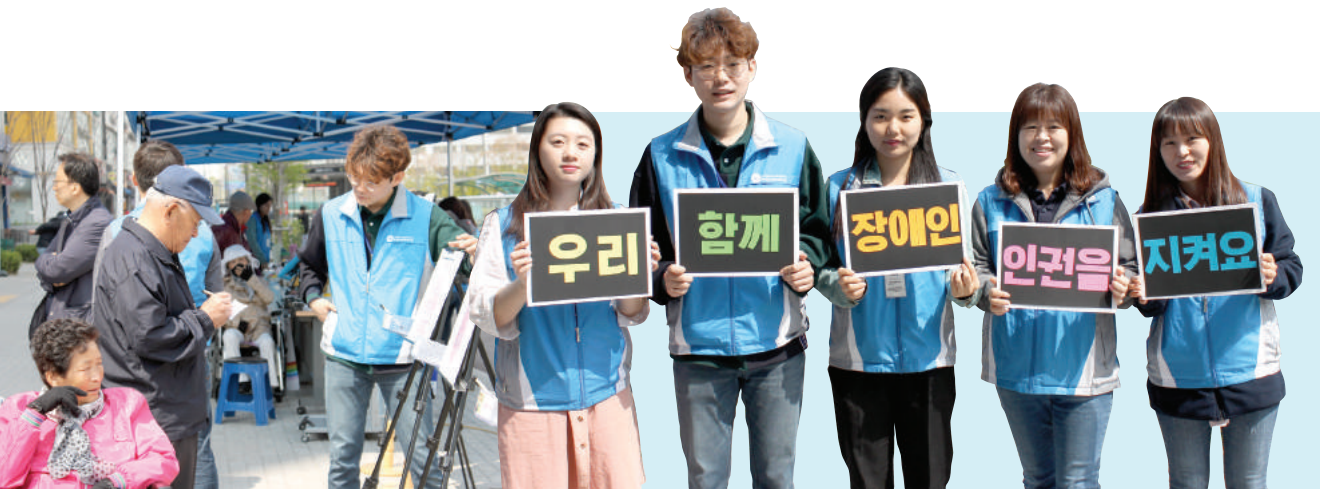
# 장애인식개선 부스운영