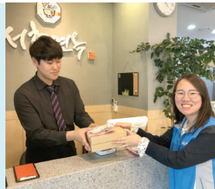
# 지역사회 나눔문화조성