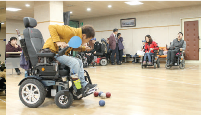
# 제10회 생활체육 보치아 평가전